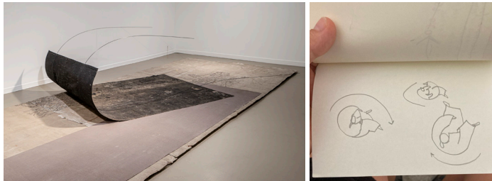
Ukemi Ushiro Ukemi, Generación 2024, La Casa Encendida.

Creo que es una forma de control; si logro manejar la pieza solo con mi cuerpo, puedo trabajarla. Pero esto también me limita en la posibilidad de tener ayuda. Por lo general, prefiero trabajar sola, precisamente porque no me siento cómoda en ese dirigir a alguien. En mi caso la escultura es un proceso solitario, aunque estoy buscando otras salidas.