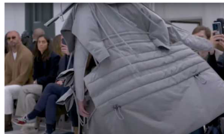
Craig Green, 2021. https://www.youtube.com/watch?v=YSfbo9F90e0&ab_channel=fashionvideos

Craig Green es un diseñador de moda con el que Milena se siente muy afín por la elección y el uso que hace de los materiales. Tejidos técnicos que le permiten un juego ágil con la forma, y otros elementos como varillas, flecos o cuerdas que ofrecen un cierto tipo de movimiento y consistencia. En una entrevista, Green apunta que, durante el proceso de creación de una prenda, ya desde las primeras fases, le gusta observarla en movimiento y que, incluso antes de elegir los tejidos, simplemente hace el ejercicio de colocar una selección de papeles de colores con los que va a trabajar sobre la pared para ver cómo funcionan entre sí y qué ritmo generan entre ellos.