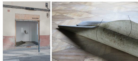
IRA elevare per impeto violento, 2022 Labena, 2022

Las dos piezas centrales que integran IRA elevare per impeto violento ahondan en un gesto que aparece en un trabajo anterior, Labena . Labena se desarrolla a partir de un pliegue en semicírculo que surgió probando las posiciones de una tela. Una vez aparece ese pliegue nace el deseo de sostenerlo y ampliar ese gesto centrándose en la línea y el movimiento. Así se constituye Labena , y se amplía a las dos piezas de IRA , en las que continúa la forma inicial y añade dos pasos, dos momentos. Como si un viento fuerte llegara y levantara la escultura. Identificar ese primer pliegue y estirarlo hacia una forma que se pueda desarrollar y transformar es, al fin y al cabo, reconocer algo muy sutil, como una vibración 8 y trabajar a partir de ese impulso.