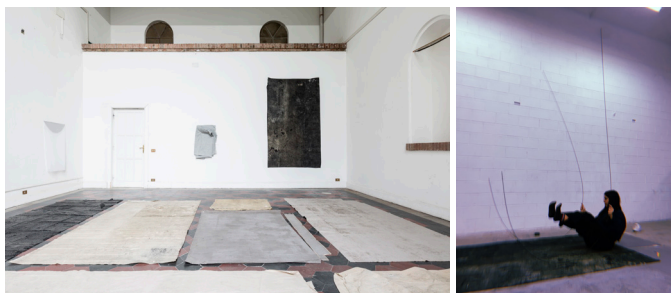
Tatami , 2018

Laurence Louppe 9 apunta que el objeto es un desvelador de los gestos que contiene dentro de sí, de la gestualidad latente en su fabricación y su manipulación. Las propuestas de Milena presentan una relación directa entre objeto y memoria que pasa por lo corporal. En el último tiempo, ha desarrollado una serie de piezas que están en relación con las proporciones del Tatami, un tapiz acolchado utilizado en Aikido que amortigua las caídas. Estas piezas planas, extendidas, operan como un elemento más del estudio; un sobresuelo por el que moverse y trabajar. La base de la instalación Ukemi Ushiro Ukemi es la superficie sobre la cuál, durante semanas, estuvo produciendo el resto de la escultura.